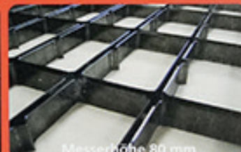
Messerhöhe 80 mm