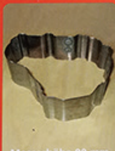
Messerhöhe 90 mm