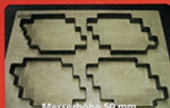
Messerhöhe 50 mm

Verpackungsindustrie – für jede Firma welche verpackt + Pharma-Industrie sowie Medizintechnik – Nahrungsmittel- Verpackungen – Lohnverpacker – Druckereien – Werbeagenturen