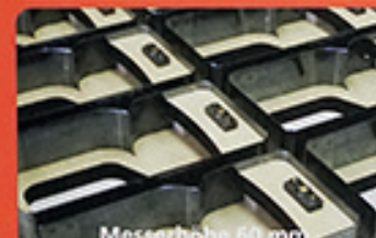
Messerhöhe 60 mm