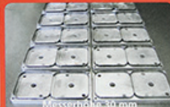
Messerhöhe 30 mm