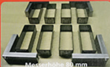
Messerhöhe 80 mm