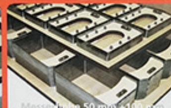
Messerhöhe 50 mm + 100 mm