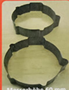
Messerhöhe 60 mm