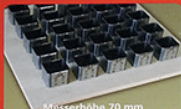
Messerhöhe 70 mm