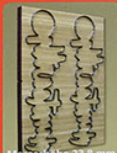
Messerhöhe 23,8 mm