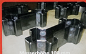
Messerhöhe 100 mm