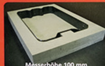
Messerhöhe 100 mm