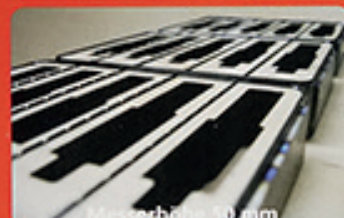
Messerhöhe 50 mm