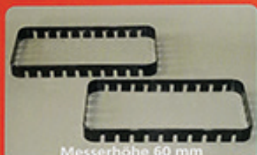
Messerhöhe 60 mm